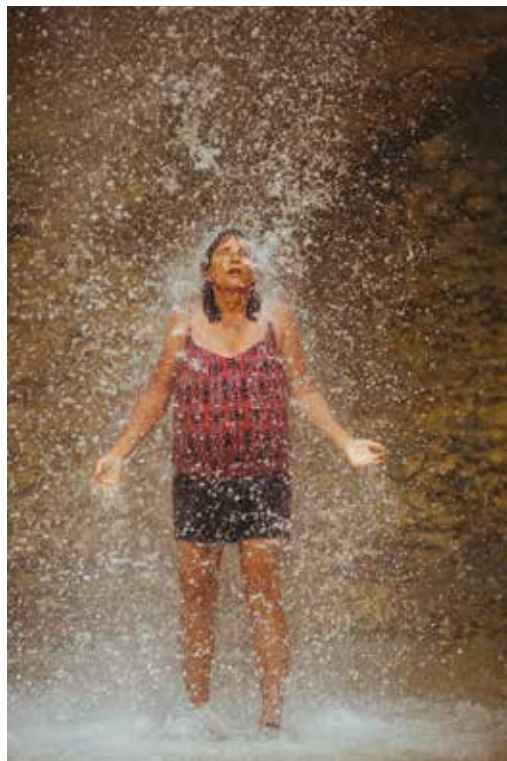
היום האחרון: טבילה מרעננת במפל עם סיום הטיפוס בוואדי מוחיירים

לבסוף החילוץ מגיע ואנחנו דוהרים לתחנת הגבול. שם מתברר לנו כי מדובר ברכב המוביל את הנוסעים בין שני עברי הגבול וכי כל מי שהיה במקום התעכב. וגם כי החזיקו את המעבר פתוח במיוחד בשבילנו. נראה שגבולות אפשר לחצות וגם לכופף אם כולם משתפים פעולה. ●